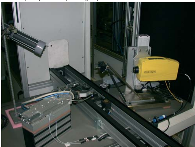
Slika 2: Lasersko merjenje vibracij v celici za kontrolo kvalitete sesalnih enot

Za podjetje DOMEL iz Železnikov smo nadaljevali raziskave in razvoj metod, ki omogočajo odkrivanje napak in merjenje kvalitete sesalnih enot. Na tej osnovi in na osnovi v preteklosti razvitega prototipa smo razvili, izdelali in implementirali diagnostični sistem za avtomatsko končno preskušanje sesalnih enot. Sistem sestavljata celica, ki meri poglobitve karakteristike motorja (napetost, tok, število vrtljajev, nivo iskrenja pri komutaciji itd.), ter celica, ki z lasersko meritvijo vibracij meri delovanje motorja (Slika 2). Diagnostični sistem je bil vgrajen v novo linijo za proizvodnjo novega tipa sesalnih enot.