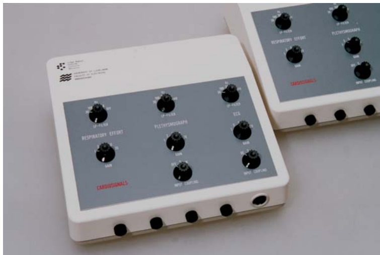
Slika 2: Pretvorniški sistem za pripravo fizioloških signalov

Med tovrstne projekte spadajo predvsem razvoj večjega števila sistemov za