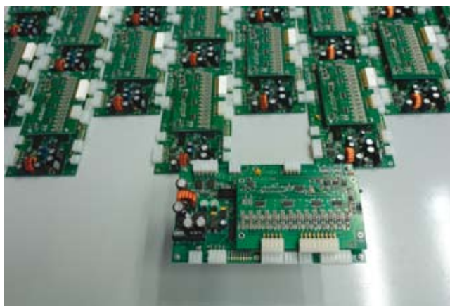
Slika 4: SmartModul – merilno-regulacijski sistem za razdeljevanje zraka pri napajanju kogeneracijskih naprav na osnovi gorivnih celic

Sodelavci odseka so imeli pomembno vlogo pri ustanovitvi "Centra za vodikove tehnologije", katerega član je tudi Institut "Jožef Stefan".