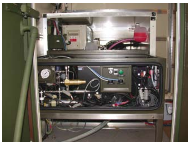
Slika 3: Vgrajen PEM-agregat 7 kW z gorivnimi celicam

Mitsubishi Electric med svojimi produkti kot novost predstavlja orodje PLC Batch, ki je bilo zasnovano na našem odseku, implementirano pa v sodelovanju med našim odsekom in podjetjem INEA, d. o. o., Ljubljana, ki je bilo tudi naročnik razvoja.