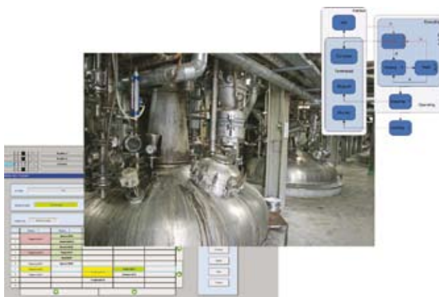
Slika 5: Vodenje šaržnega procesa sinteze smol v podjetju Color na osnovi orodja PLCbatch

Sodelavci odseka so del aktivnosti posvetili vodenju Centra odličnosti za sodobne tehnologije vodenja, v katerem sodeluje 14 podjetij in 4 akademske institucije.